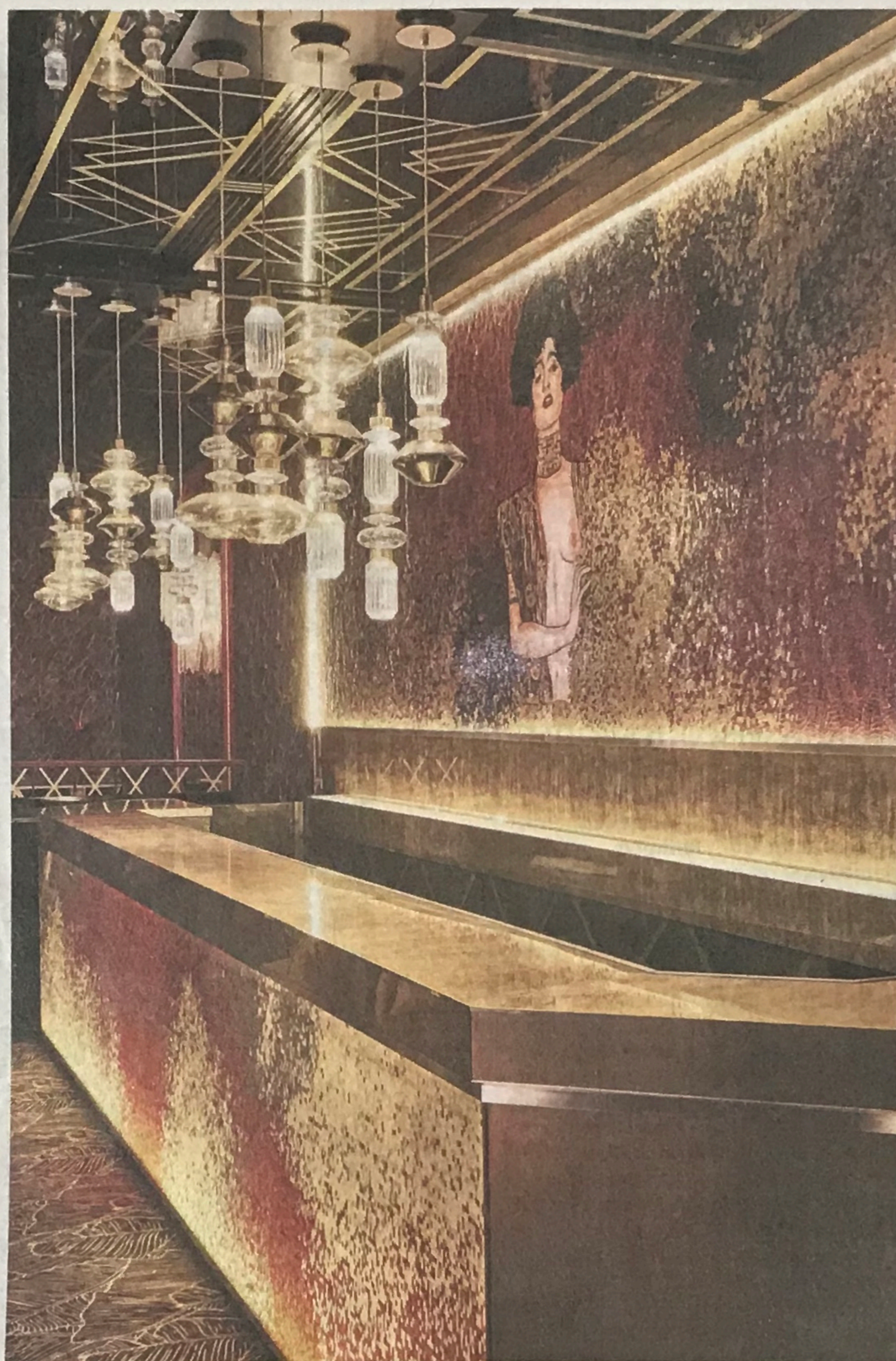
Au Paradis latin, à Paris, le bar du premier étage avec la mosaïque de l'italien Sicis.